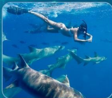
** NURSE SHARK SNORKELING