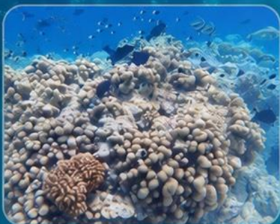
NICE HOUSE REEF