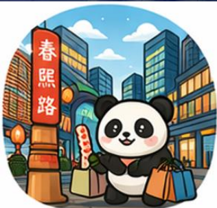
ถนนคนเดินชุนซีลู่ (Chunxi Road)

จากนั้นอิสระท่าน ถนนคนเดินชุนซีลู่ ย่านช้อปปิ้งชื่อดังและคึกคักที่สุดของเมืองดู เต็มไปด้วยห้างสรรพสินค้า ร้านแบรนด์ดัง ร้านอาหาร และสตรีทฟู้ด เหมาะ สำหรับช้อปปิ้งและสัมผัสวิถีชีวิตคนเมือง และ ถนนคนเดินไท่กู่หลี่ แหล่งช้อปปิ้ง โลฟิสต์สไตล์สุดทันสมัย ผสมผสานสถาปัตยกรรมจีนโบราณกับดีไซน์โมเดิร์นอย่างลงตัว รายล้อมด้วยร้านค้าแบรนด์ดัง คาเฟ่ และมุมถ่ายรูปสวยๆ มากมาย