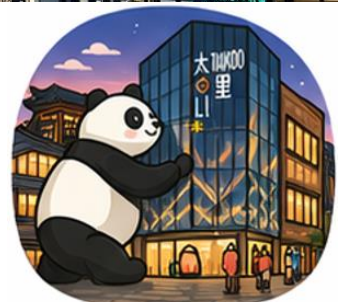
ถนนคนเดินไท่กู่หลี่ (Taikoo Li)

จากนั้นอิสระท่าน ถนนคนเดินชุนซีลู่ ย่านช้อปปิ้งชื่อดังและคึกคักที่สุดของเมืองดู เต็มไปด้วยห้างสรรพสินค้า ร้านแบรนด์ดัง ร้านอาหาร และสตรีทฟู้ด เหมาะ สำหรับช้อปปิ้งและสัมผัสวิถีชีวิตคนเมือง และ ถนนคนเดินไท่กู่หลี่ แหล่งช้อปปิ้ง โลฟิสต์สไตล์สุดทันสมัย ผสมผสานสถาปัตยกรรมจีนโบราณกับดีไซน์โมเดิร์นอย่างลงตัว รายล้อมด้วยร้านค้าแบรนด์ดัง คาเฟ่ และมุมถ่ายรูปสวยๆ มากมาย