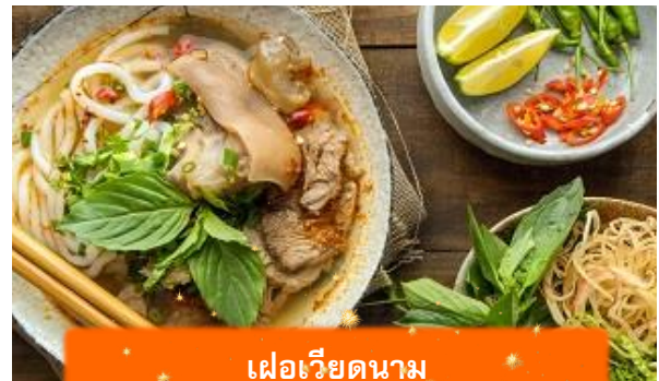
เฟอเวียดนาม