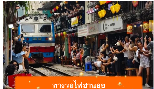
ทางรถไฟฮานอย

17.55 เดินทางถึง สนามบินสุวรรณภูมิ ประเทศไทย โดยสวัสดิภาพ ... พร้อมความประทับใจ