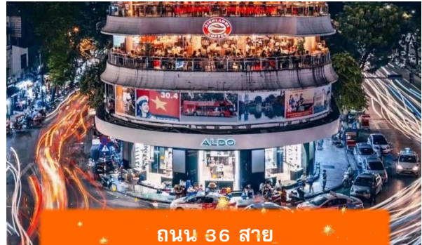
ถนน 36 สาย