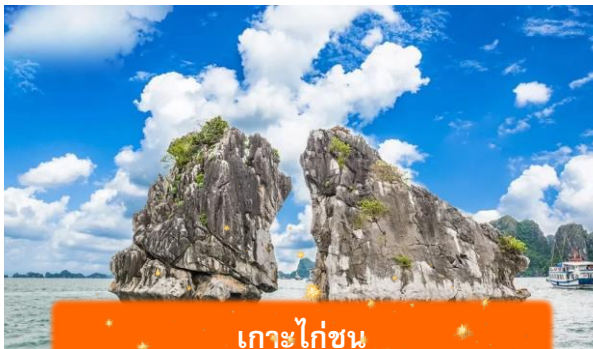
เกาะไก่อ๋น

เที่ยง บริการอาหารกลางวัน ณ ภัตตาคาร พิเศษ ... เมนูซีฟู้ดบนเรือ