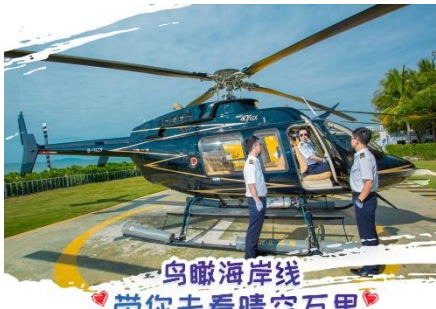
鸟瞰海岸线 带你去看晴空万里

โทรศัพท์ : 042-246662 / 086-4515274 E-mail : journeyticket@hotmail.com