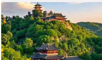
เขาเหยาหวังชาน