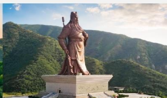
บ้านเกิดท่านกวนจู