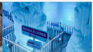
ถ้ำน้ำแข็งอวันชีวซาน

*ทางบริษัทฯ ขอสงวนสิทธิ์ในการสลับโปรแกรมทัวร์ตามความเหมาะสมขึ้นอยู่กับสถานการณ์หน้างาน โดยคำนึงถึงผลประโยชน์ของลูกค้าเป็นสำคัญ