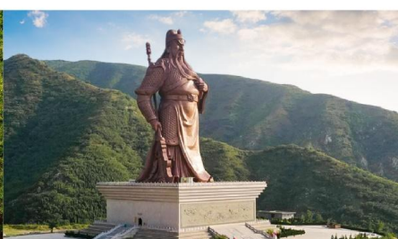
บ้านเกิดท่านกวนอู