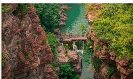
อุทยานสวรรค์หยุนโกซาน