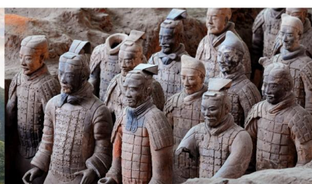
สุสานทหารจีนซี

*ทางบริษัทฯ ขอสงวนสิทธิ์ในการสลับโปรแกรมทัวร์ตามความเหมาะสมขึ้นอยู่กับสถานการณ์หน้างาน โดยคำนึงถึงผลประโยชน์ของลูกค้าเป็นสำคัญ