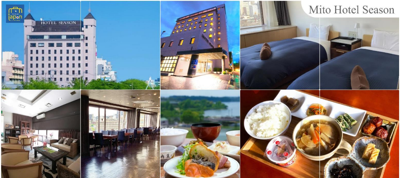
Mito Hotel Season

เป็น รับประกันอาหารเย็น ณ ภัตตาคาร (1) พักที่ MITO HOTEL SEASON, IBARAKI หรือระดับเดียวกัน