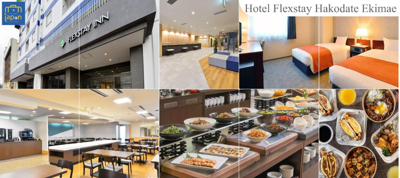
Hotel Flexstay Hakodate Ekimae

FLEX STAY INN HAKODATE EKIMAE หรือเทียบเท่าระดับเดียวกัน