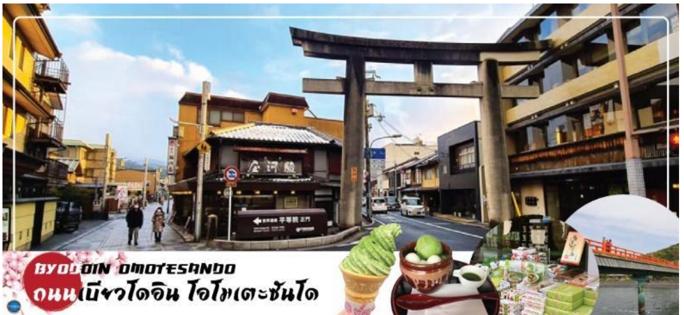
BYODOIN OMOTESANDO ถนนเมียวโดอิน โอโมเตะซันโด

เพราะตลอดสองข้างทางเต็มไปด้วยร้านขนม ร้านอาหาร ที่เกือบทั้งหมดทำมาจากอุจิมัทจะ ไม่ว่าจะเป็นชอฟูครีมชาเขียว ราเม็งชาเขียว โชบะชาเขียว เกียวซ่าชาเขียว ไปจนถึงทาโกยากิ ชาเขียว ให้คุณได้แวะชิมลิ้มรสชาติชาเขียวอุจิดันตำรับและยังมีขนมที่ทำจากอุจิมัทจะ ให้ซื้อกลับไปเป็นของฝากได้อีกด้วย ไม่เว้นแม้แต่ ตุ๊กกาชาปอง, ตุ๊กไอศกรีม, และตุ๊กดน้ำ ที่ใช้โทนสีให้เข้าธีมถนนชาเขียวรวมถึงน้ำและขนมในตุ๊กดก็เป็นรสชาติชาเขียวทั้งหมด