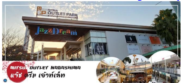
MITSUI OUTLET PARK NAGASHIMA แจ๊ซ ดรีม เอ้าท์เล็ต

สถานที่ที่รวบรวมสินค้าแบรนด์เนม และสินค้าแบรนด์ญี่ปุ่น โกอินเตอร์มากกว่า 240 ร้านค้า มากที่สุดในประเทศ ให้ท่านได้เลือกซื้อสินค้าเสื้อผ้า อาทิ MK Michel Klein, Morgan, Ecco, United Colours of Benetton, Lacoste ฯลฯ กระเป๋า Bally, Coach, Gucci, Gap, Armani เลือกดูเครื่องประดับ และนาฬิกาอย่าง G-Shock, Seiko, Tag Heuer, Agete, S.T.Dupont, Tasaki, Longines ฯลฯ รองเท้าแฟชั่นและกีฬา Adidas, Nike, Kappa, Hush Puppies ฯลฯ และสินค้าอื่นๆ อีกมากมายซึ่งอยู่ในพื้นที่เดียวกันทั้งหมด