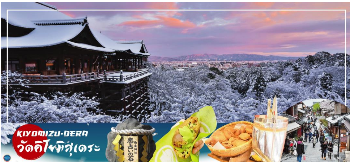
KIYOMIZU-DEERA วัดคิโยมิสึเดระ