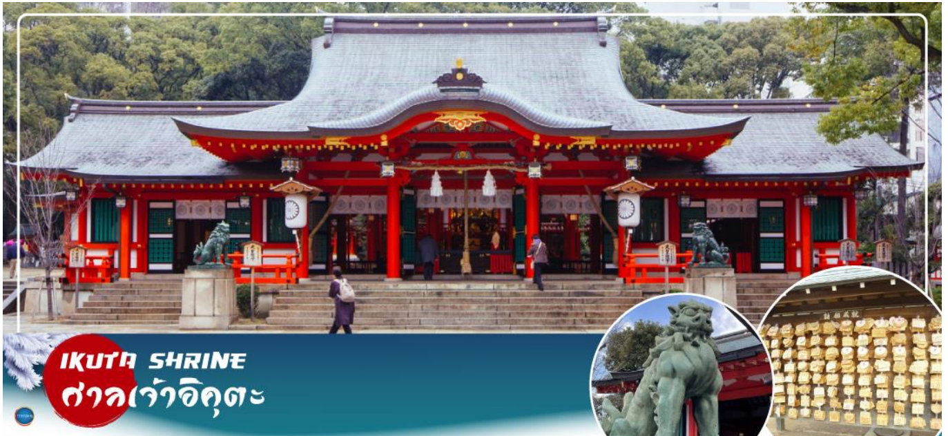
IKUTA SHRINE ศาลเจ้าอิคุตะ

จากนั้นนำท่านสักการะ ศาลเจ้าอิคุตะ (Ikuta Shrine) ตั้งอยู่ในย่านใจกลางเมืองซันโนะมียะ (Sannomiya) เป็นศาลเจ้าที่มีประวัติศาสตร์ยาวนาน ก่อตั้งในปี 201 หนึ่งในสามศาลเจ้าหลักของโกเบที่มีประวัติศาสตร์ยาวนานกว่า 1,800 ปี ทางเหนือไปตามถนนชื่อถนนอิคุตะ คุณจะเห็นทางเข้าศาลเจ้าพร้อมประตูโทริอิที่สร้างโดยใช้วัสดุรีไซเคิลจากศาลเจ้าใหญ่อิเสะ ศาลเจ้าอิคุตะมีชื่อเสียงในด้านผลประโยชน์ในการจับคู่ เนื่องจากจิตอาสน์บนถนนเป็นเทพเจ้าผู้ทอเสื้อผ้าของเทพเจ้า และเธอทอด้วยและด้ายเข้าด้วยกัน คนในพื้นที่เรียกกันอย่างเสนาหว่า "อิคุตะซัง"