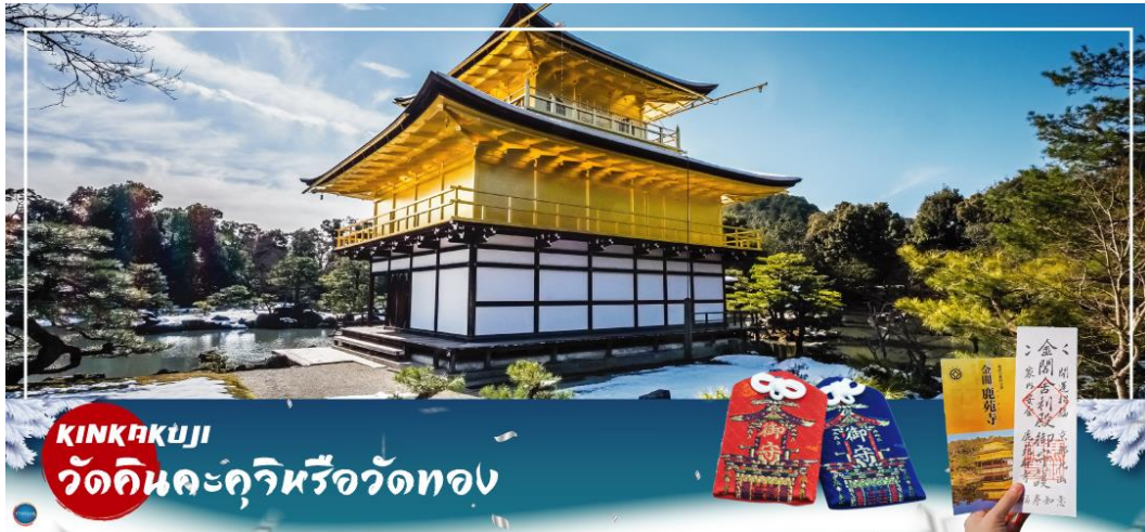
KINKAKUJI วัดคินคะคุจิหรือวัดทอง

วันที่สาม เมืองโอซาก้า – เมืองเกียวโต – วัดคินคะคุจิ – การเรียนพิธีชงชาญี่ปุ่น - วัดคิโยมิสึเดระ – ย่านชิคาชิยาม่า – เมืองโอซาก้า – ศาลเจ้านัมมะงายากะ – ช้อปปิ้งชินไซบาชิ