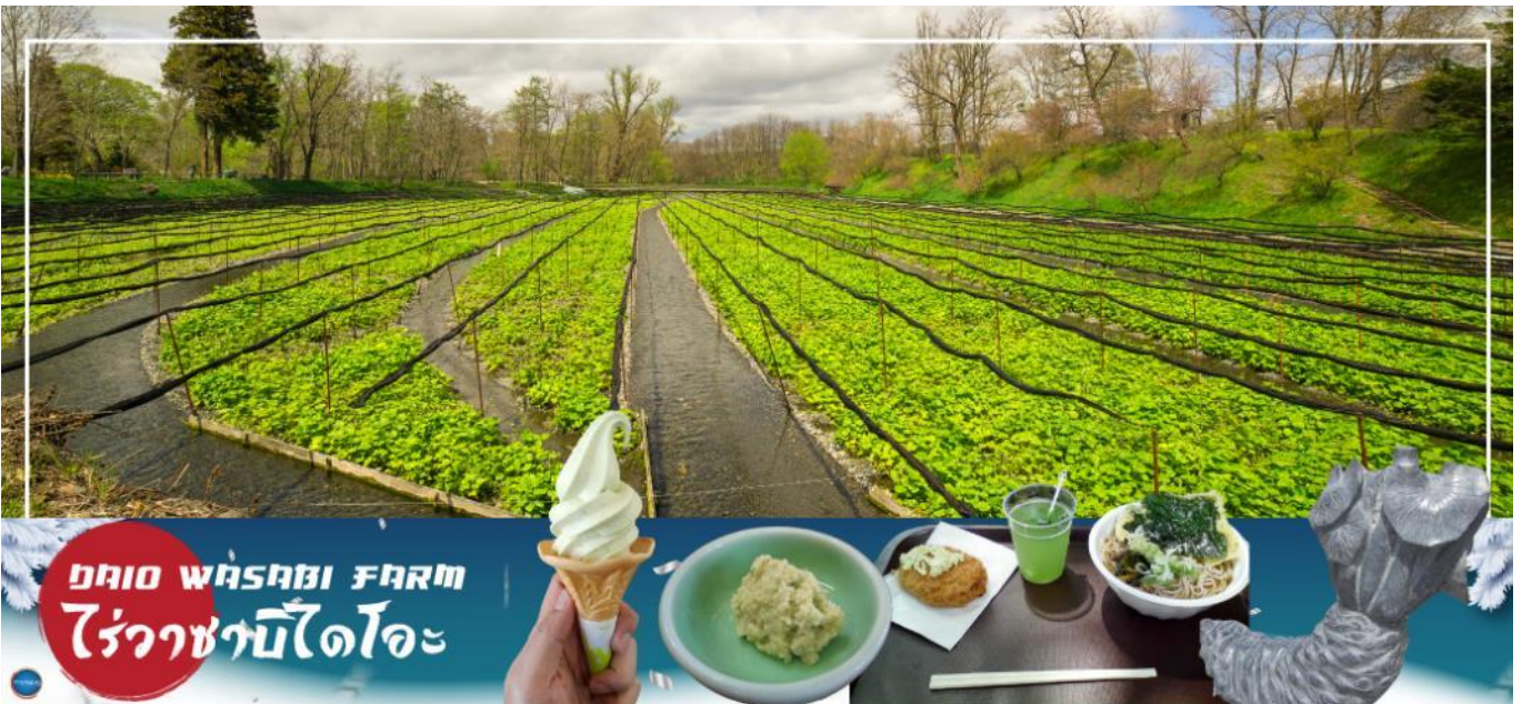
DAIO WASABI FARM ไร่วาซาบิไดโอะ

วันที่สาม เมืองทาคายามะ – ไร่วาซาบิไดโอะ – เมืองนากาโนะ – ซาคุยะ – HAKUBA IWATAKE MOUNTAIN RESORT (กอนโดล่า ลิฟท์) – เมืองมัตสึโมโตะ – อีออน มอลล์มัตสึโมโตะ