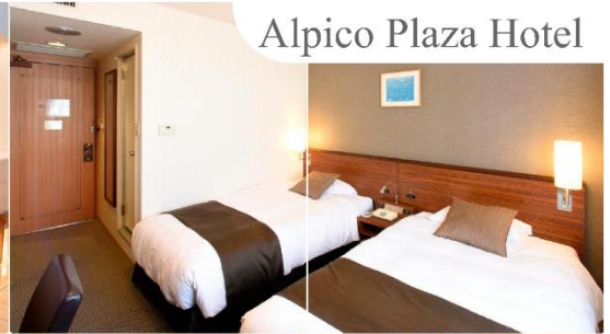
Alpico Plaza Hotel