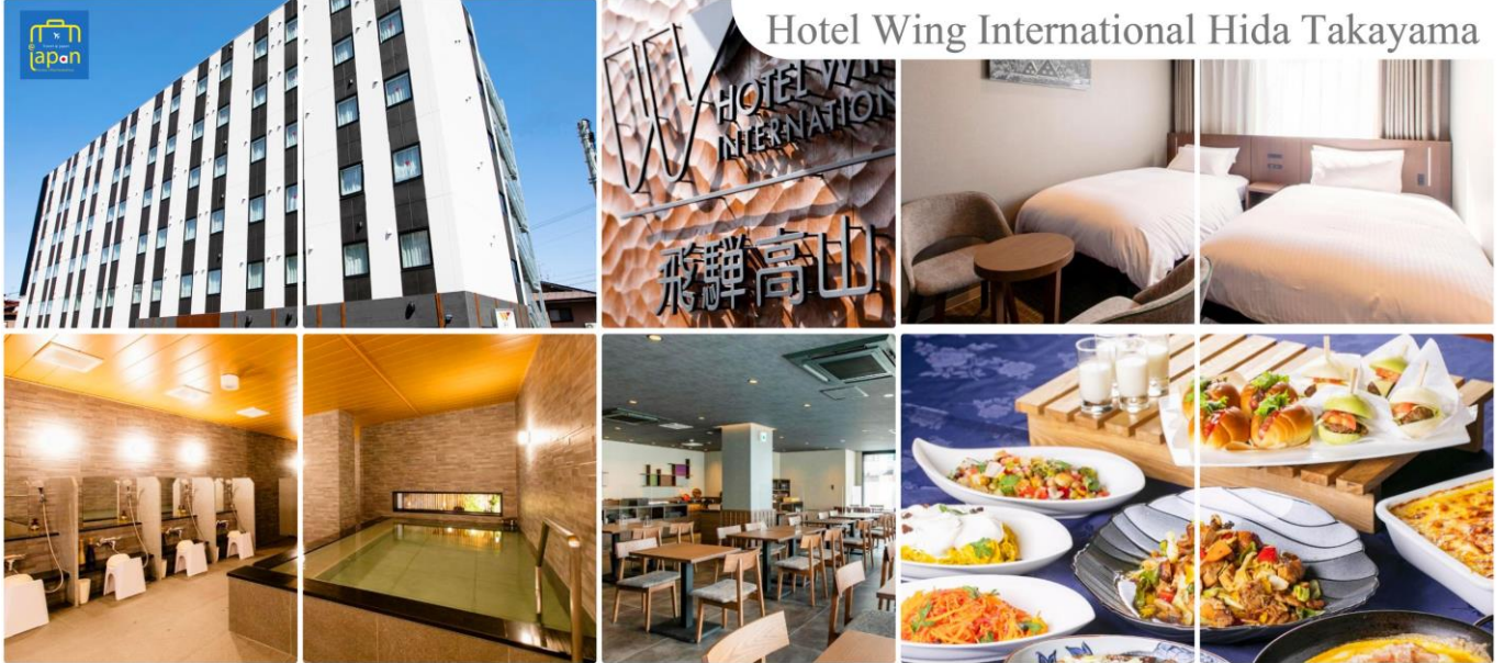
Hotel Wing International Hida Takayama

โทรศัพท์ : 042-246662 / 086-4515274 E-mail : journeyticket@hotmail.com