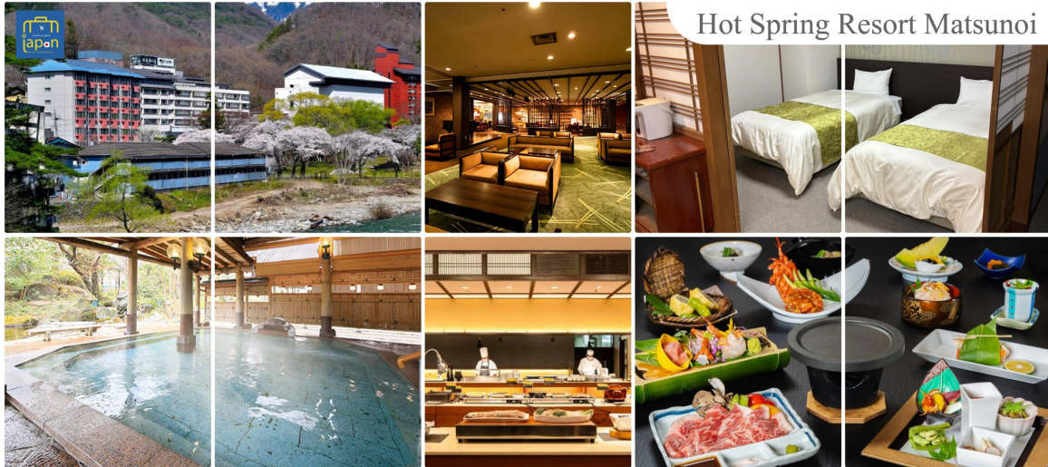
Hot Spring Resort Matsunoi

รับประทานอาหารเช้า ณ กัสดาคาร ของโรงแรม (5) --- บุฟเฟต์นานาชาติ หลังอาหารให้ท่านได้ผ่อนคลายกับการแช่น้ำแร่ธรรมชาติ เชื่อว่าถ้าได้แช่น้ำแร่แล้ว จะทำให้ ผิวพรรณสวยงามและช่วยให้ระบบหมุนเวียนโลหิตดีขึ้น