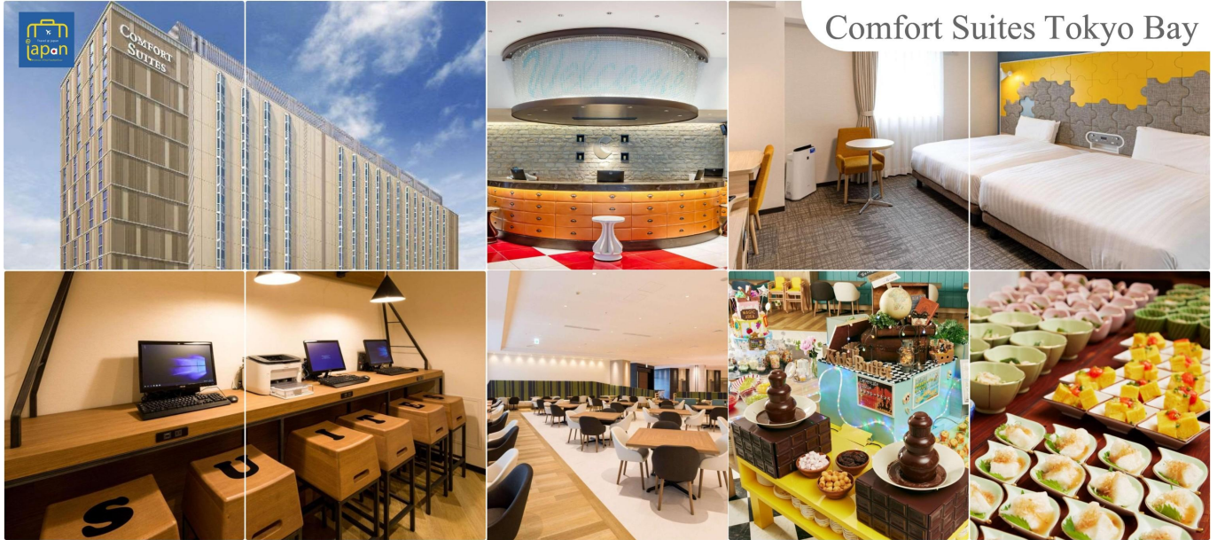
Comfort Suites Tokyo Bay

COMFORT SUITES TOKYO BAY หรือเทียบเท่าระดับเดียวกัน