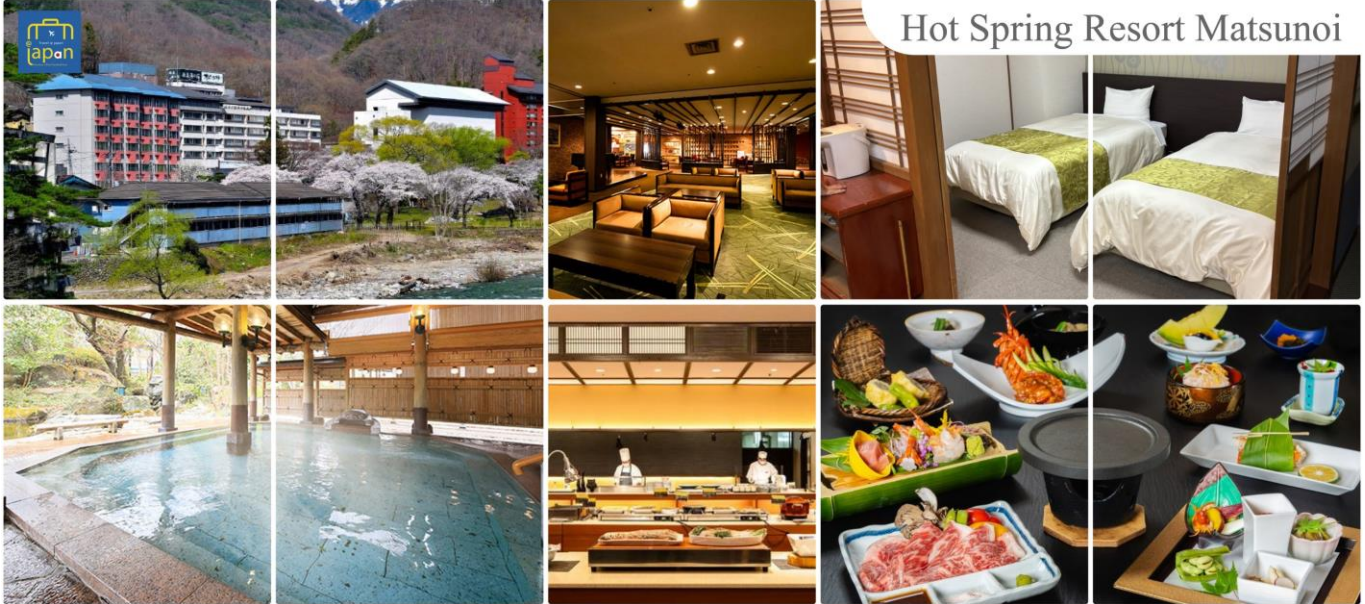
Hot Spring Resort Matsunoi

โทรศัพท์ : 042-246662 / 086-4515274 E-mail : journeyticket@hotmail.com