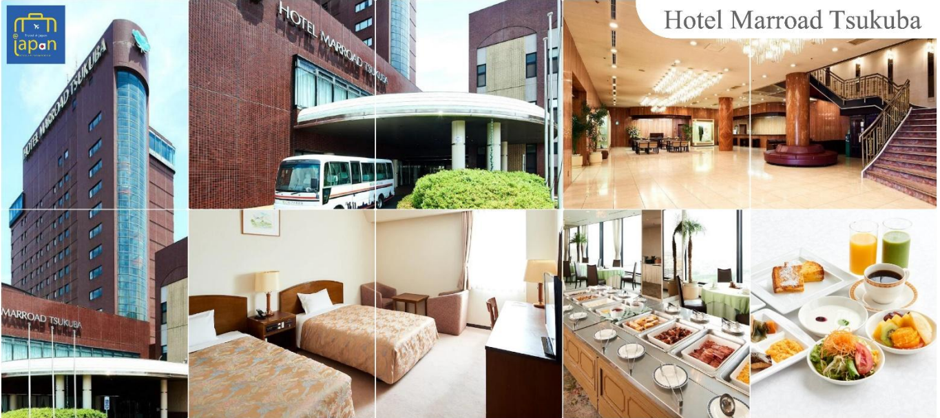
Hotel Marroad Tsukuba

โทรศัพท์ : 042-246662 / 086-4515274 E-mail : journeyticket@hotmail.com