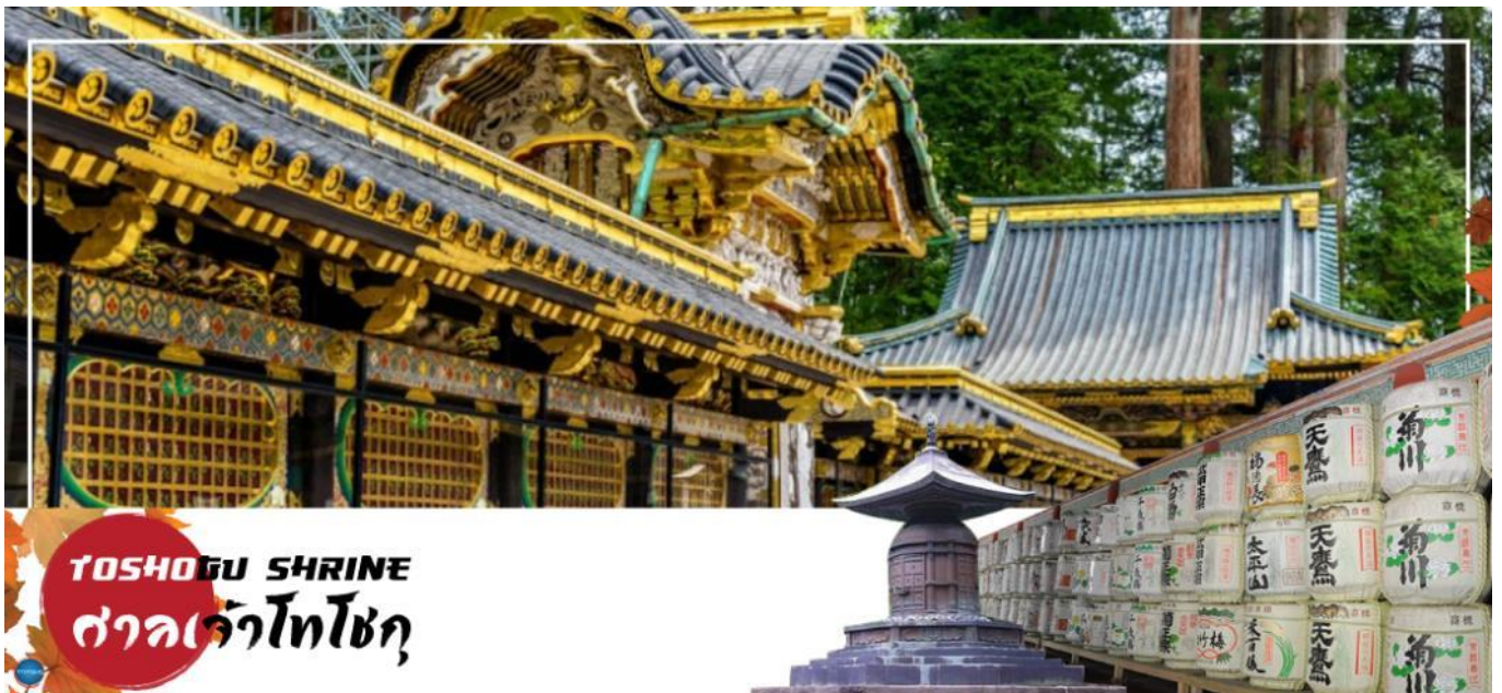
TOSHOGU SHRINE ศาลเจ้าโทโชกุ

วันที่สาม เมืองนิกโกะ – ผ่านชม สะพานชินเคียว – ศาลเจ้าโทโชกุ – ศาลเจ้าฟูตาระ – จังหวัดไซตามะ – ย่านเมืองเก่าคาวะโกเอะ – ดรอกลูกกวาด – เมืองยามานาชิ – ออนเซ็น + ชาบูยักษ์