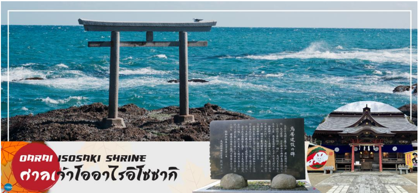
OARAI ISOSAKI SHRINE ศาลเจ้าโออาริโซซากิ

ได้เวลาอันสมควรนำท่านเดินทางสู่ เมืองนาริตะ (ใช้เวลาเดินทางประมาณ 1.40 ชั่วโมง)