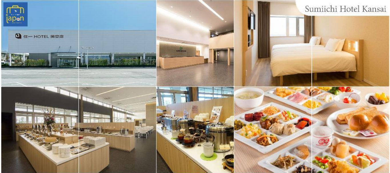
Sumiichi Hotel Kansai

โทรศัพท์ : 042-246662 / 086-4515274 E-mail : journeyticket@hotmail.com