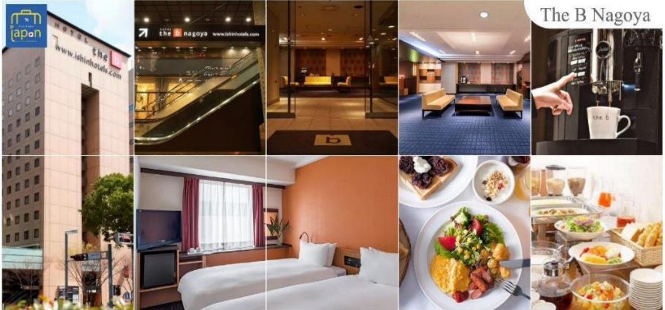
พักที่ HOTEL THE B NAGOYA หรือเทียบเท่าระดับเดียวกัน

โทรศัพท์ : 042-246662 / 086-4515274 E-mail : journeyticket@hotmail.com