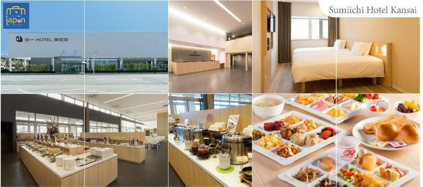
Sumiichi Hotel Kansai

โทรศัพท์ : 042-246662 / 086-4515274 E-mail : journeyticket@hotmail.com