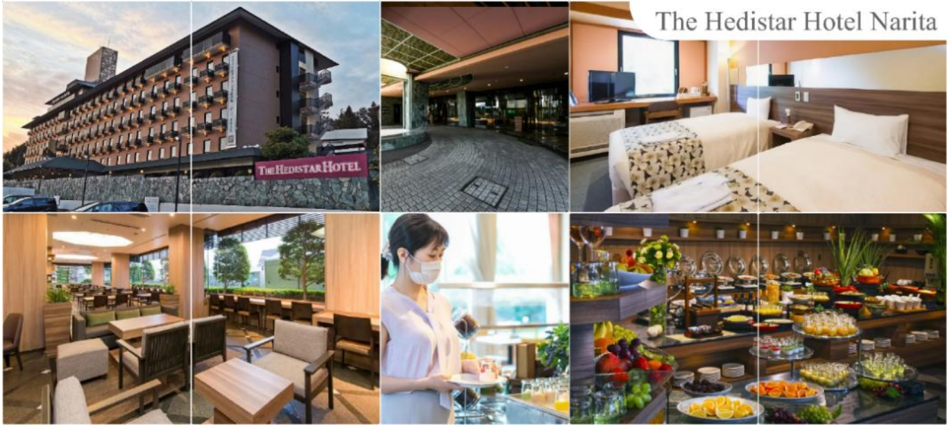
The Hedistar Hotel Narita

พักที่ THE HEDISTAR HOTEL NARITA หรือระดับเดียวกัน