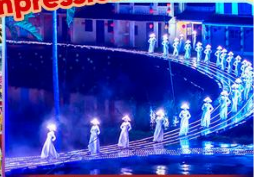
Hoi An Impression Show