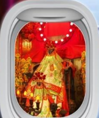
เจ้าแม่กวนอิมของฮำ