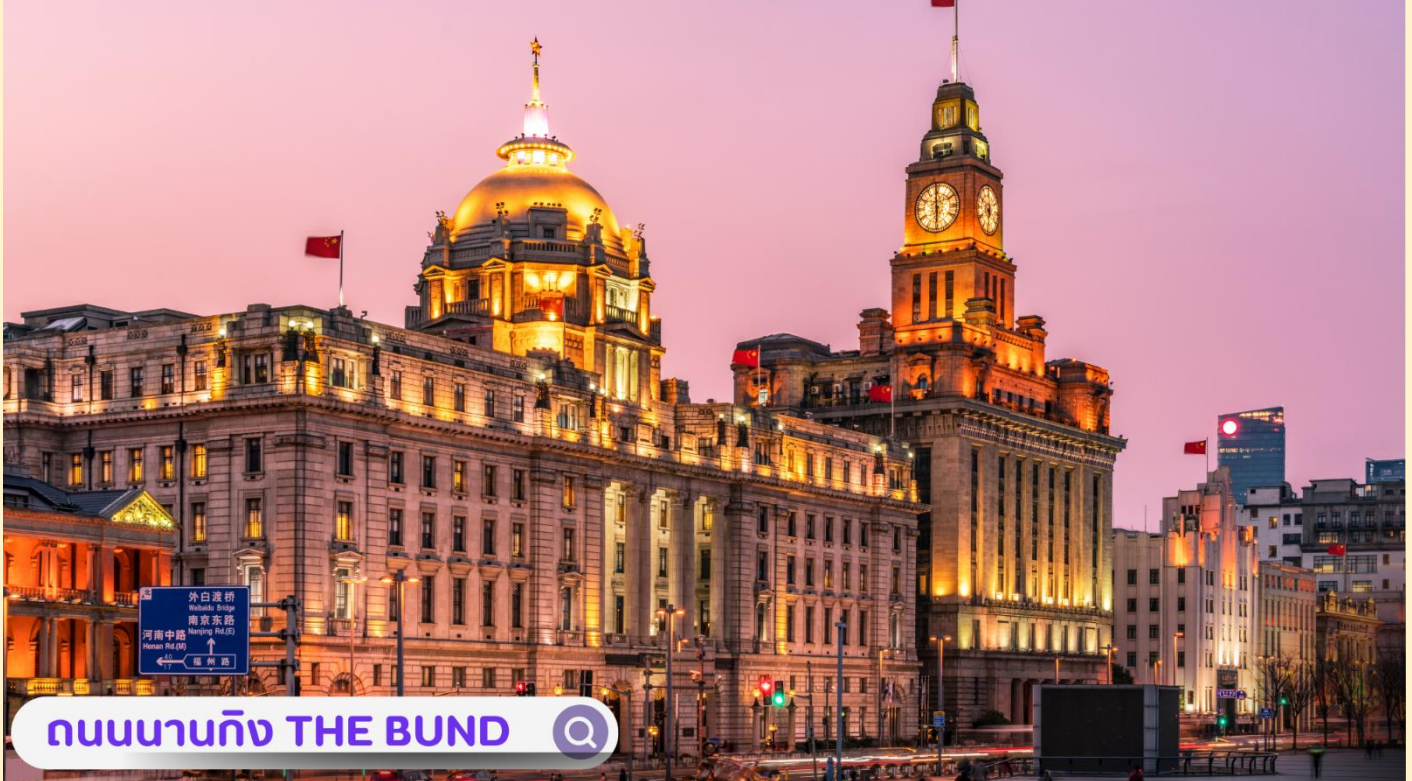
ถนนนาวิก THE BUND

จากนั้นอิสระท่านเพิลิตเพลินที่ ถนนนาจิง(NANJING ROAD) เป็นย่านช้อปปิ้งเก่าแก่ที่สุดของเซี่ยงไฮ้ เป็นตลาดซื้อขายของกันคึกคักตั้งแต่ทศวรรษ 1920 ตั้งอยู่ฝั่งผู้ซีกินพื้นที่ยาวตั้งแต่ฝั่งตะวันตกของ “เดอะ บันด์” ถึง “พีเพิลส์ สแควร์” เป็นแหล่งช้อปปิ้งสินค้าแบรนด์เนมจากทั่วโลก และยังเป็นศูนย์รวมร้านค้าและร้านอาหารอีกมากมาย และพลาดไม่ได้กับนักจุ่มอาร์ททยอยอย่าง แบรินด์ POPMART GLOBAL FLAGSHIP STORE ร้านขายของเล่นที่เป็นที่โด่งดังในขณะนี้ไม่ว่าจะ LABUBU MOLLY SKULLPANDA และอย่างอื่นอีกมากมาย ให้ท่านได้เลือกลุ้นกันอย่างสนุกสนาน