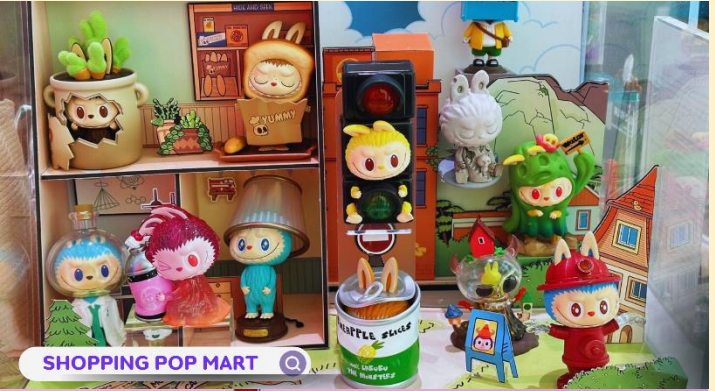
SHOPPING POP MART