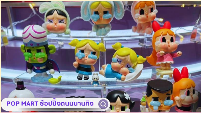
POP MART ซ้อปิ้งถนนนาวิก