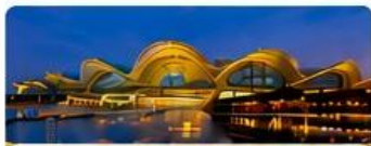
พิก FEI XING HOTEL เทียบเท่า 4 ดาว Local