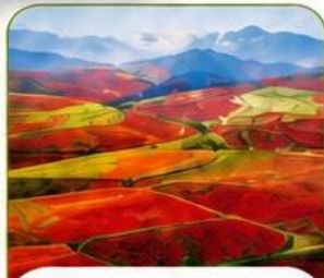
แผ่นดินสีแดงตงชวน