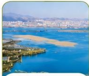
ทะเลสาบเตียนฉือ