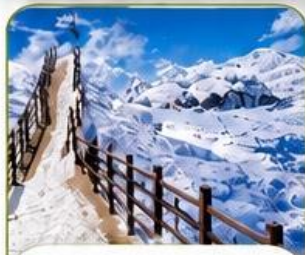
ภูเขาหิมะเจียวจื่อ

เดินทาง พฤศจิกายน 2569 - กุมภาพันธ์ 2570