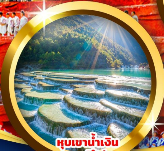
หุบเขาน้ำเงิน ทะเลสาบไป๋ส่วยเหอ