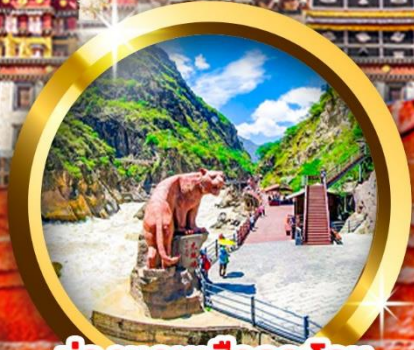
ช่องแคบเสื่อกระโถน