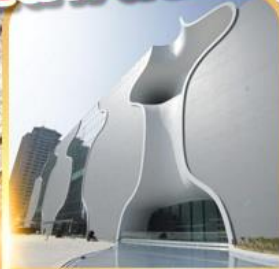
โรงละครโดง