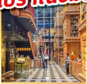
ร้านไอศกรีมมียาฮาร์