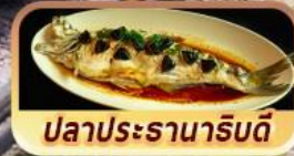
ปลาประจานารับดี