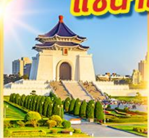
อนุสรณ์เจียงไคเชค

นั่งรถไฟปองปอง! ชมวิวไถ่ฝิงซาน แช่น้ำแร่ร้อนตัวในห้องพัก