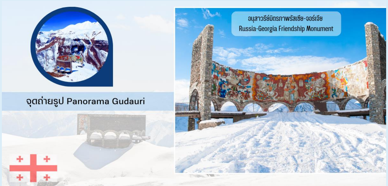
จุดถ่ายรูป Panorama Gudauri

โทรศัพท์ : 042-246662 / 086-4515274 E-mail : journeyticket@hotmail.com