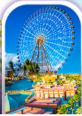
เมืองแฟนตาซี