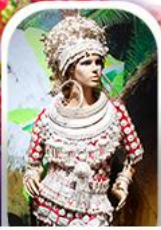
หมู่บ้านชนเผ่า