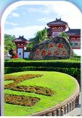
อุทยานหนานซาน