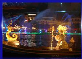
ชมโชว์เวนิสจำลอง แกรนด์วิลด์