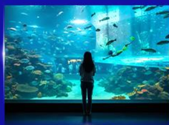
อควาเรียมยักษ์รูปเต่า