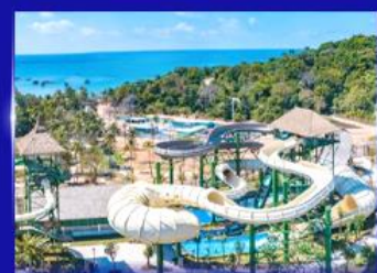
สวนสนุก Sun world Hon thom