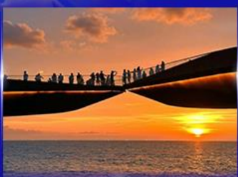
สะพานจูบ Sunset Town