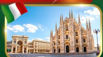
เชคอิน มหาวิหารดูโอโมแห่งมิลาน