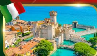
เมืองสวยริมทะเลสาบ เซอร์บิโอน