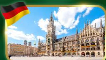
เชคอิน จัตุรัสมาเรียนพลัทซ์