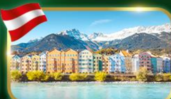
อินส์บรุค เมืองสวยที่อกซาเอลป์