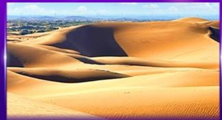
ทะเลทรายอินเคินทาลา