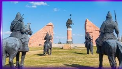
สวนสาธารณะเจงกิสข่าน