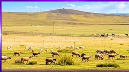
ทุ่งหญ้าชิลามูห์ริน