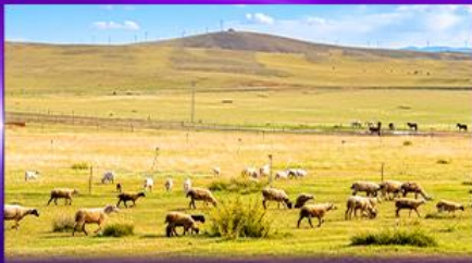
ทุ่งหญ้าซิลามูเฮริน