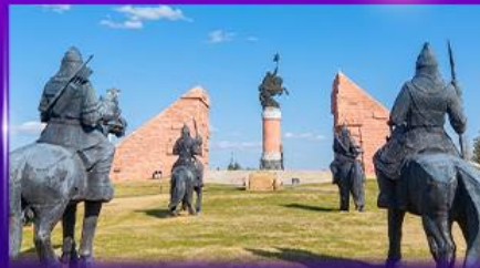
สวนสาธารณะเจงกิสข่าน