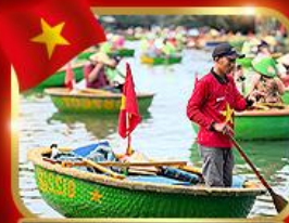
เรือกระด้ง หมู่บ้านกิมทาม