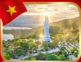
ชอพรกวนอิม วัดหลั่นอ๊ว