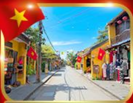
เมืองมรดกโลก ฮอยอัน