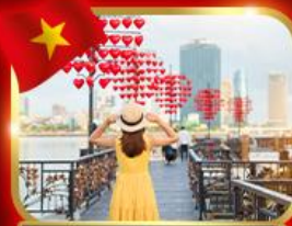
เช็คอินสะพานแห่งความรัก