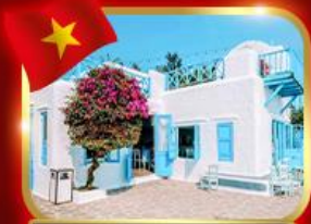
คาเฟ่สุดชิค ชานทรา มาริน่า