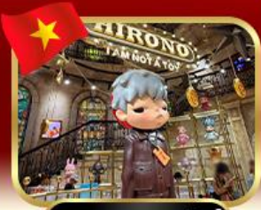
popmart บานาฮิลล์