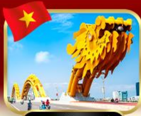
สะพานมังกร ดานัง