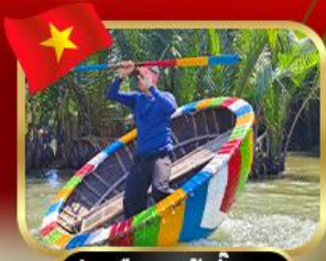
ล่องเรือกระดิ่งกัมทาน