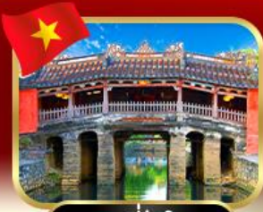
สะพานญี่ปุ่นโบราณ