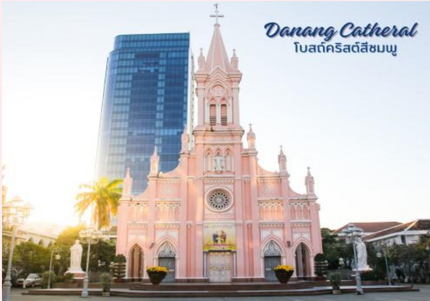
Danang Cathedral โบสถ์คริสต์สีชมพู

นำท่านถ่ายรูป โบสถ์คริสต์ดานัง หรือโบสถ์คริสต์สีชมพู (Danang Cathedral) สร้างขึ้นสมัยเวียดนาม ตกเป็นอาณานิคมของฝรั่งเศส สถาปัตยกรรมสไตล์โกธิก ยตกแต่งด้วยความประณีตสวยงาม ตัวโบสถ์เป็นสีชมพูทั้งหลัง ตัดขอบด้วยสีขาว เป็นอีกหนึ่งสถานที่ที่ไม่ควรต้องพลาดเมื่อมาเยือนเมืองดานัง จากนั้น อีสระช้อปปิ้ง ตลาดฮาน อีสระเลือกซื้อสินค้าหลากหลายชนิด เช่นผ้า เหล้า บุหรี่ และของกินต่างๆ เป็นตลาดสดและขายสินค้าพื้นเมืองของเมืองดานัง