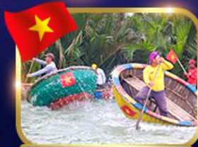
ล่องเรือกระดิว หมู่บ้านกิมถาน