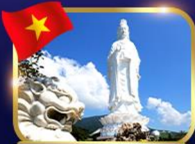
ชมพระอภิวัดฮอยอัน