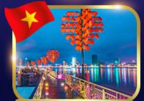
สะพานแห่งความรัก ดานัง