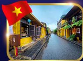
เมืองเก่ามรดกโลก ฮอยอัน