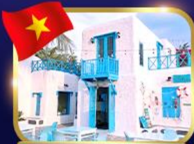
คาเฟ่สไตล์ซานโตรินี่ ฮอยอัน