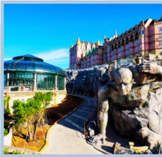
โซน Eclipse Square