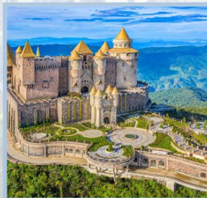
ปราสาทจันทร