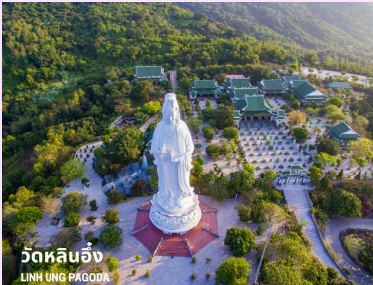
วัดหลินอึ้ง LINH UNG PAGODA

ได้เวลาอันสมควร นำท่านลงจากเขาบานาฮิลล์ เดินทางสู่เมืองดานัง ระหว่างทางนำท่านแวะร้านหยกและอัญมณี อีสรระในการเลือกซื้อสินค้า