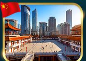
เช็คอินตึกไควซิงโหล