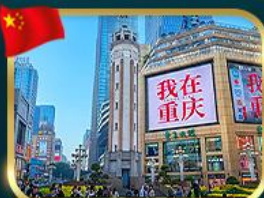
ถนนคนเดินเจียงฟางเป่ย์