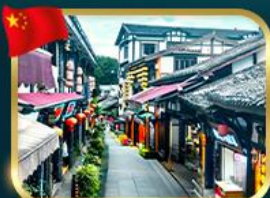
หมู่บ้านโบราณฉือฮั่ว

เที่ยวอุทยานหลุมฟ้าสะพานสวรรค์ + ชานานงฟ้า