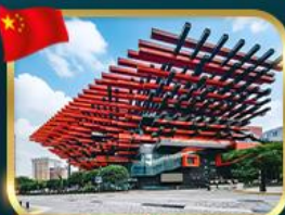
แลนด์มาร์กจิ้ง ตึกตะเกียบ