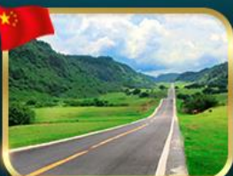
ชมวิวยุทยานชานานงฟ้า