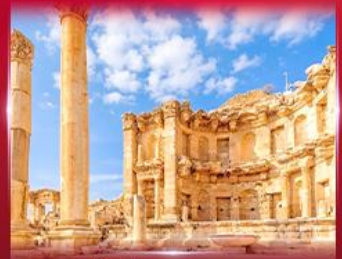
เมืองโบราณเจราซ