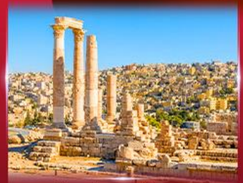
ปิรามปรการอัมมาน