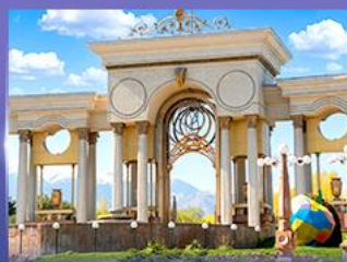
สวนสาธารณะประธานาธิบดี