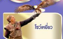
โชว์เหยี่ยว