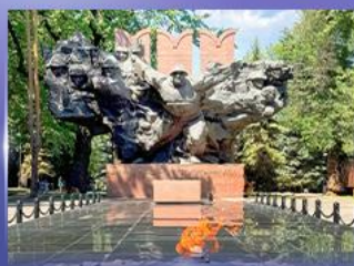
สวนสาธารณะ 28 Panfilov Park