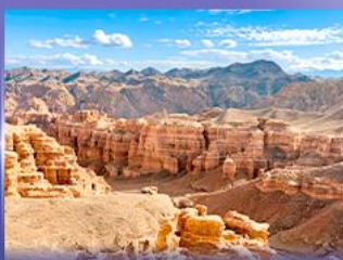
หุบเขาซาริน แคนยอน