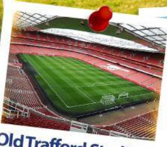
Old Trafford Stadium