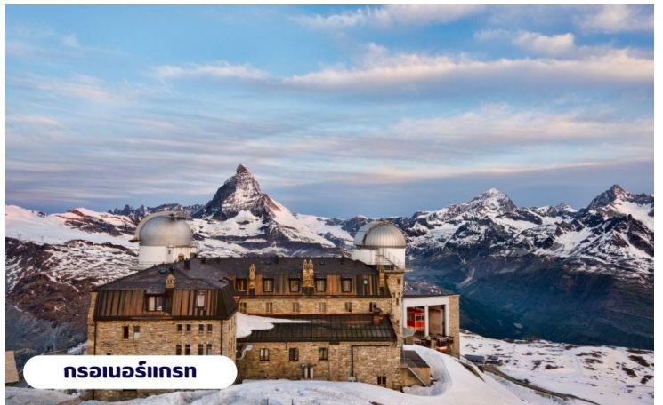
กรอเนอร์กรัท

ถึงเวลาอันสมรนำท่านเดินทางกลับสู่เมืองเซอร์แมทอีกครั้งโดยรถไฟ อิสระท่านเดินเล่นชมเมืองเซอร์แมท เลือกซื้อสินค้าของฝากพื้นเมือง หรือนาฬิกาสวิส อันขึ้นชื่อตามอัธยาศัย สมควรแก่เวลานำท่านขึ้นรถไฟกลับสู่เมืองเทสซ์