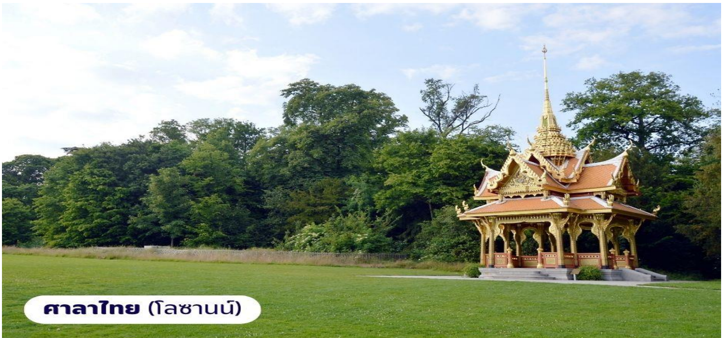
ศาลาไทย (โลซานน์)

🕒 บริการอาหารกลางวัน ณ ภัตตาคาร นำท่านเดินทางสู่ เมืองโลซานน์ ใช้เวลาเดินทางประมาณ 1 ชั่วโมง เมืองที่มีเสน่ห์โดยธรรมชาติมากที่สุดเมืองหนึ่งของประเทศสวิตเซอร์แลนด์ ตั้งอยู่บนเนินเขาริมฝั่งทะเลสาบเจนีวา มีความสวยงามโดยธรรมชาติ กับทิวทัศน์ที่สวยงาม และอากาศที่ปราศจากมลพิษ จึงดึงดูดนักท่องเที่ยวจากทั่วโลกให้มาพักผ่อนตากอากาศ นำท่านถ่ายภาพ อาคารสำนักงานโอลิมปิกสากล ซึ่งตั้งอยู่บริเวณทะเลสาบเลคเลมังค์ จากนั้นนำท่านถ่ายภาพและเยี่ยมชม ศาลาไทย ที่รัฐบาลไทยได้ร่วมกันก่อสร้างให้เมืองโลซานน์ ในวโรกาสเฉลิมฉลองพระบาทสมเด็จพระเจ้าอยู่หัวทรงครองราชย์ครบ 60 ปีและเชื่อมความสัมพันธ์ไทย-สวิสฯ ครบ 75 ปี