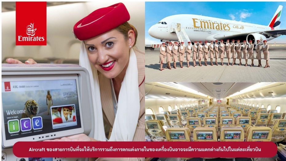
Aircraft ของสายการบินนี้จะให้บริการรวมถึงการตกแต่งภายในของเครื่องบินอาจมีความแตกต่างกันไปในแต่ละเที่ยวบิน

22.00 น. !!!! ขณะเดินทางพร้อมกัน ณ สนามบินสุวรรณภูมิ อาคารผู้โดยสารขาออกระหว่างประเทศ ชั้น 4 ประตู 9 แถว T สายการบินเอมิเรตส์ แอร์ไลน์ (EK) เจ้าหน้าที่ให้การต้อนรับและอำนวยความสะดวก