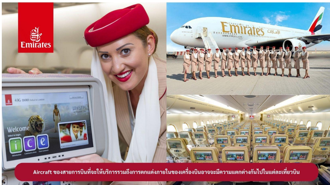
Aircraft ของสายการบินที่จะให้บริการรวมถึงการตกแต่งภายในของเครื่องบินอาจมีความแตกต่างกันไปในแต่ละเที่ยวบิน

22.30 น. !!!! ขณะเดินทางพร้อมกัน ณ สนามบินสุวรรณภูมิ อาคารผู้โดยสารขาออกระหว่างประเทศ ชั้น 4 ประตู 9 แถว T สายการบินเอมิเรตส์ แอร์ไลน์ (EK) เจ้าหน้าที่ให้การต้อนรับและอำนวยความสะดวก