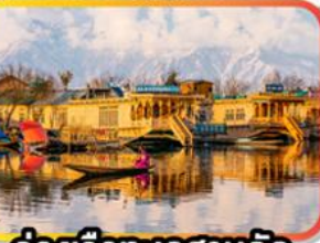
ล่องเรือทะเลสาบคิล