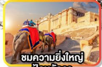
ชมความยิ่งใหญ่ ป้อมอัครา