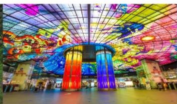
Dome of Light