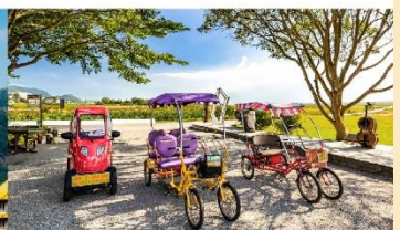
ปั่นจักรยานเล่นที่ Mr. Brown Avenue

*ทางบริษัทฯ ขอสงวนสิทธิ์ในการสลับโปรแกรมทัวร์ตามความเหมาะสมขึ้นอยู่กับสถานการณ์หน้างาน โดยคำนึงถึงผลประโยชน์ของลูกค้าเป็นสำคัญ