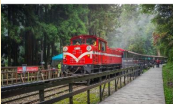
อุทยานแห่งชาติอาลีซาน