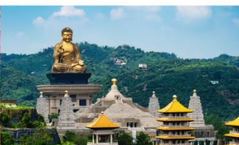
วัดฟอกวงชาน