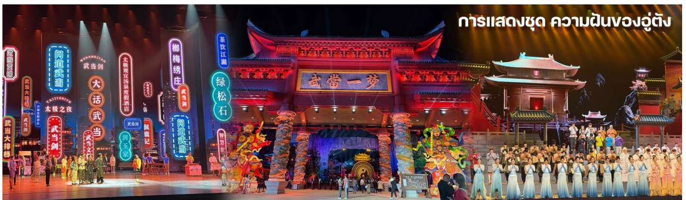
การแสดงชุด ความฝันของอู่ต้ง

Yanqingyuan Hotel ระดับ 4 ดาว หรือเทียบเท่ามาตรฐานจีน (โรงแรมที่ระบุในรายการทัวร์เป็นเพียงโรงแรมที่นำเสนอเบื้องต้นเท่านั้น ซึ่งอาจมีการเปลี่ยนแปลง แต่โรงแรมที่เข้าพักจะเป็นโรงแรมระดับเทียบเท่ากัน)