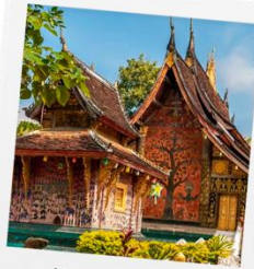
วัดเชียงทอง