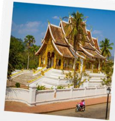
พิพิธภัณฑฯ