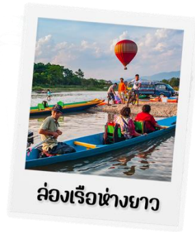
ล่องเรืออ่างยาว