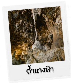
ถ้ำนางฟ้า