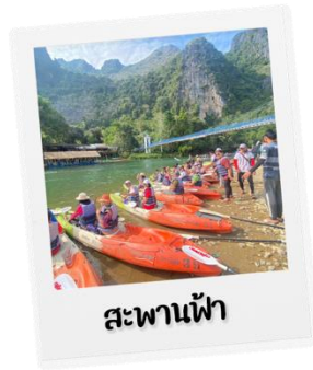
สะพานฟ้า