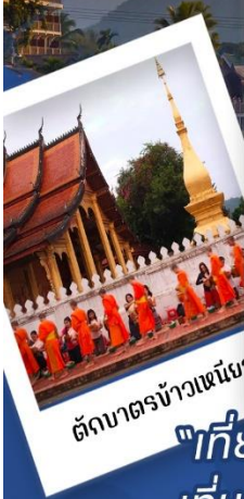
วัดบึงพระลานชัย