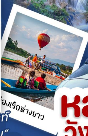
ล่องเรือห่างยาว

"เที่ยวครบ จบทุกไฮไลท์ เที่ยวสบายๆ ไม่เหน็ดเหนื่อย"