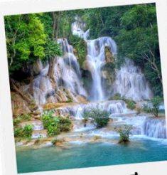
ตาดกวางสี