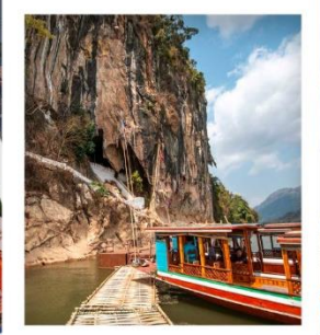
ล่องเรือชมจำดั่ง