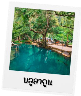
บถูลากูน

โทรศัพท์ : 042-246662 / 086-4515274 E-mail : journeyticket@hotmail.com