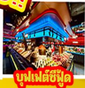
บุนเฟตซีฟู้ด