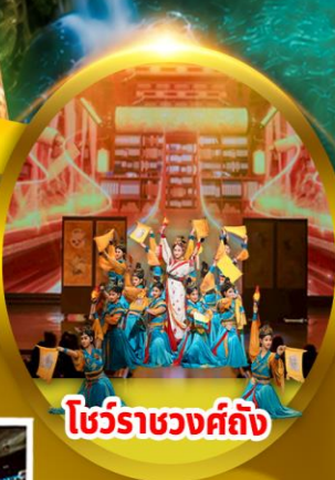
โขนราชวงศ์ถัง