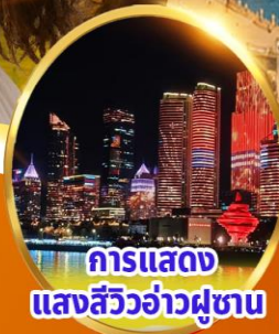
การแสดงแสงสีว้าว่าผู้ขาน